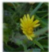
Le laiteron maraîcher ( Sonchus oleraceus )

A titre d'exemple, que voyons sur ce bout de trottoir d'environ un mètre ?