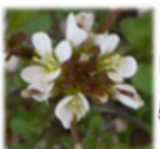
La cardamine hérissée ( Cardamine hirsuta )