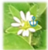
Le mouron des oiseaux ( Stellaria media )