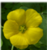
L'oxalis corniculé ( Oxalis corniculata )