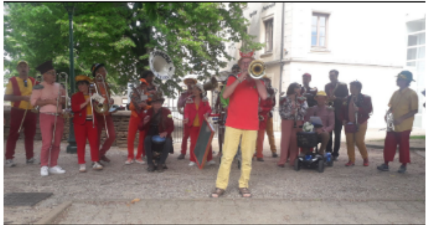
Convergence vélo à Hières sur Amby en 2025