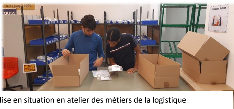
Cf. Mise en situation en atelier des métiers de la logistique

Bilan de la semaine : une cinquantaine de kilomètres (dont 40 sous la pluie), beaucoup de dénivelés et des visites intéressantes au théâtre du Vellein et en entreprise. On a même eu l'occasion de découvrir les métiers de la logistique en faisant un « cas pratique » avec l'entreprise Fergus à Saint Quentin Fallavier. A la fin, tout le monde décide de repartir avec son vélo dont 3 en groupe pour rentrer à l'Isle d'Abeau... les distances ne font plus peur.