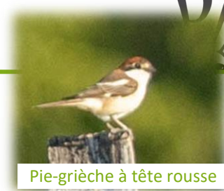
Pie-grièche à tête rousse