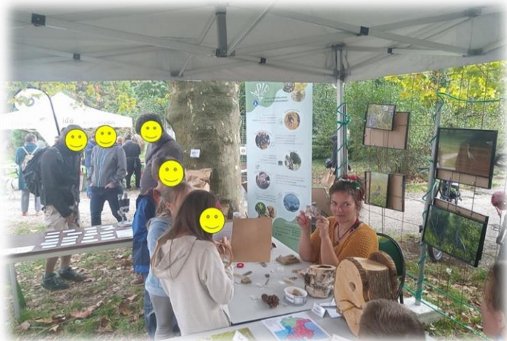
Le stand de l'APIE : les enfants enquêtent sur les traces et indices de la faune sauvage locale