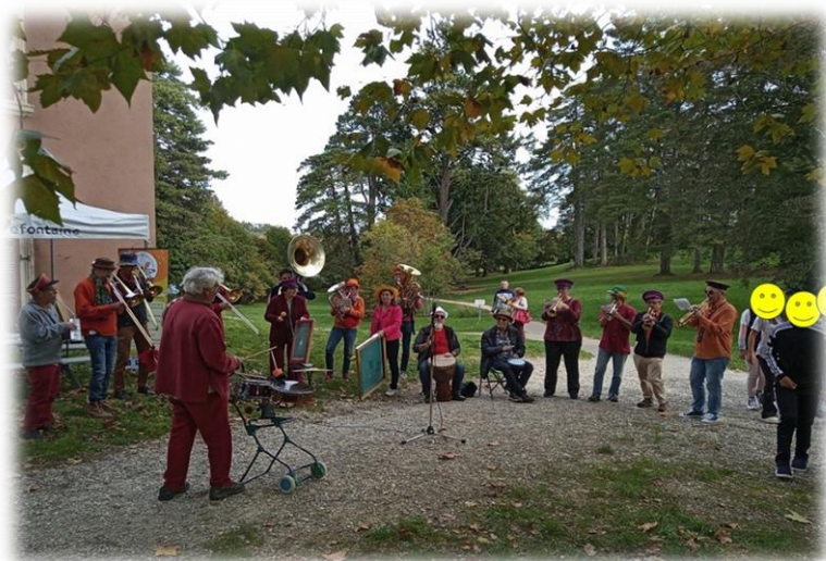
← Les « Tonnerre de Brens » en action