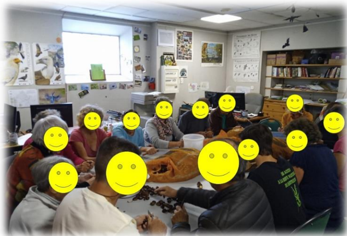
← Séance décortiquage de châtaignes