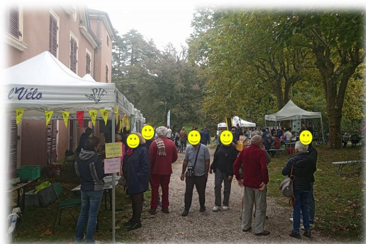
Devant le stand d'Osez l'Vélo →