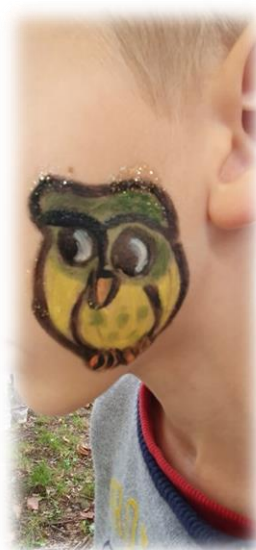
← Maquillage tendance APIE automne 2023