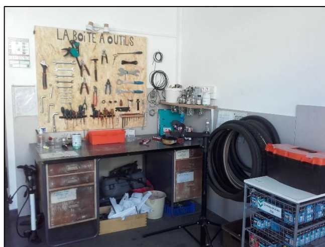
Un autre traitement de l'auto-réparation grâce à des tâches plus modestes