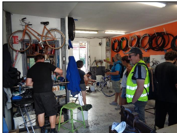
L'accueil de l'atelier du Cyclub

L'atelier de Janus France à Oullins offre une autre perspective de l'activité