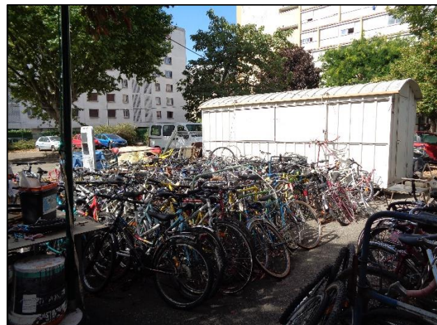
Le stockage est toujours une question encombrante dans un atelier