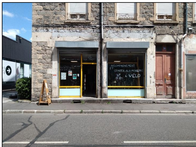
Un atelier de bord de route