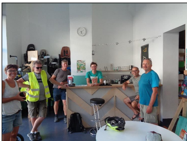
Derniers échanges de la journée...