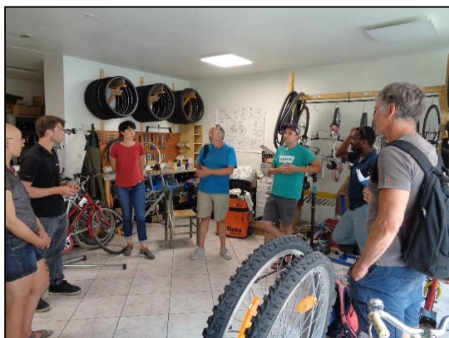
De riches échanges...