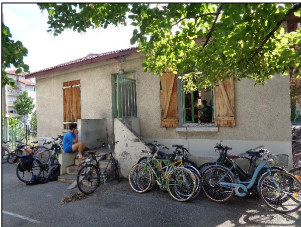
La petite maison du Cyclub au cœur de Villeurbanne

Voici une sélection de photos prises par Guy, Maria et moi.