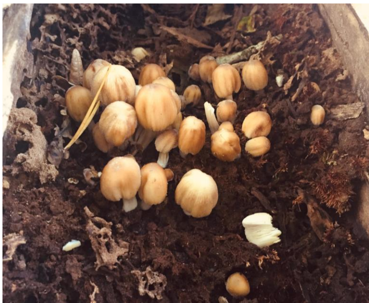
Village de lutins, au creux d'un arbre mort