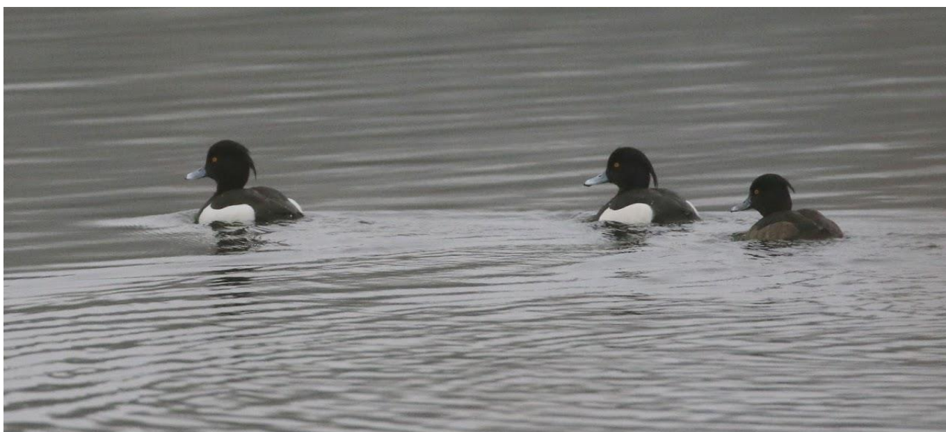
Fuligules morillon en promenade