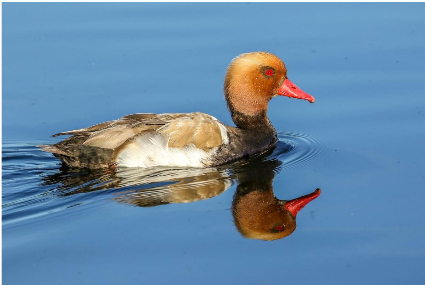
Nette rousse qui porte bien son nom