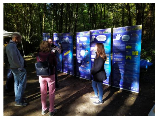
Le stand de FNE Isère