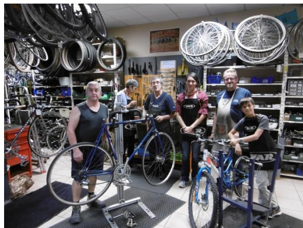
Ouvert à toutes et tous, quel que soit votre âge.

Les soirées démontage : les premiers jeudis du mois vous pouvez venir à l'atelier entre 17h et 19h pour participer au démontage de vélos. Nous récupérons environ 200 vélos par an, certains sont vendus mais d'autres sont démontés. C'est ce qui permet d'avoir un stock de pièces d'occasion diverses et variées pour retaper vos vélos. Inutile d'avoir des connaissances en mécanique. Des vélos à démonter sont installés sur les pieds supports, des bénévoles aguerris à cet exercice sont là pour vous aiguiller et si vous souhaitez découvrir comment un montage mécanique fonctionne c'est le moment d'en démonter un. Que ce soit un roulement de roue, de pédalier, de direction, le montage des manivelles (axe carré, à clavette) ou autres. Si vous souhaitez vous entraîner au démontage de pneus, exercice qui demande à être répété avant d'être acquis, c'est également le moment idéal. Ce sera beaucoup plus efficace que le visionnage d'un tutoriel en vidéo !