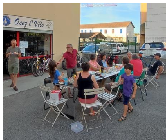
Reprise des repas le 1 er juillet 2021 après un an et demi de privation.

Après l'effort, le réconfort : à 19h les supports vélos, les outils et les pièces sont rangées pour laisser la place à des tables et des chaises et au repas partagé. Suivant votre emploi du temps et vos motivations vous pouvez participer au démontage en première partie de soirée ou à la seconde partie pour le repas ou aux deux. Entre février 2020 et mai 2021 ces soirées démontages ont été interrompues. Nous avons repris en juin avec la partie démontage mais sans repas puis en juillet avec repas dans la cour de l'atelier, façon pique-nique, chacun amène ce qu'il mange. Avec les nouvelles règles sanitaires qui s'appliquent depuis le 30 août 2021, la soirée démontage du 2 septembre 2021 se clôturera sans repas.