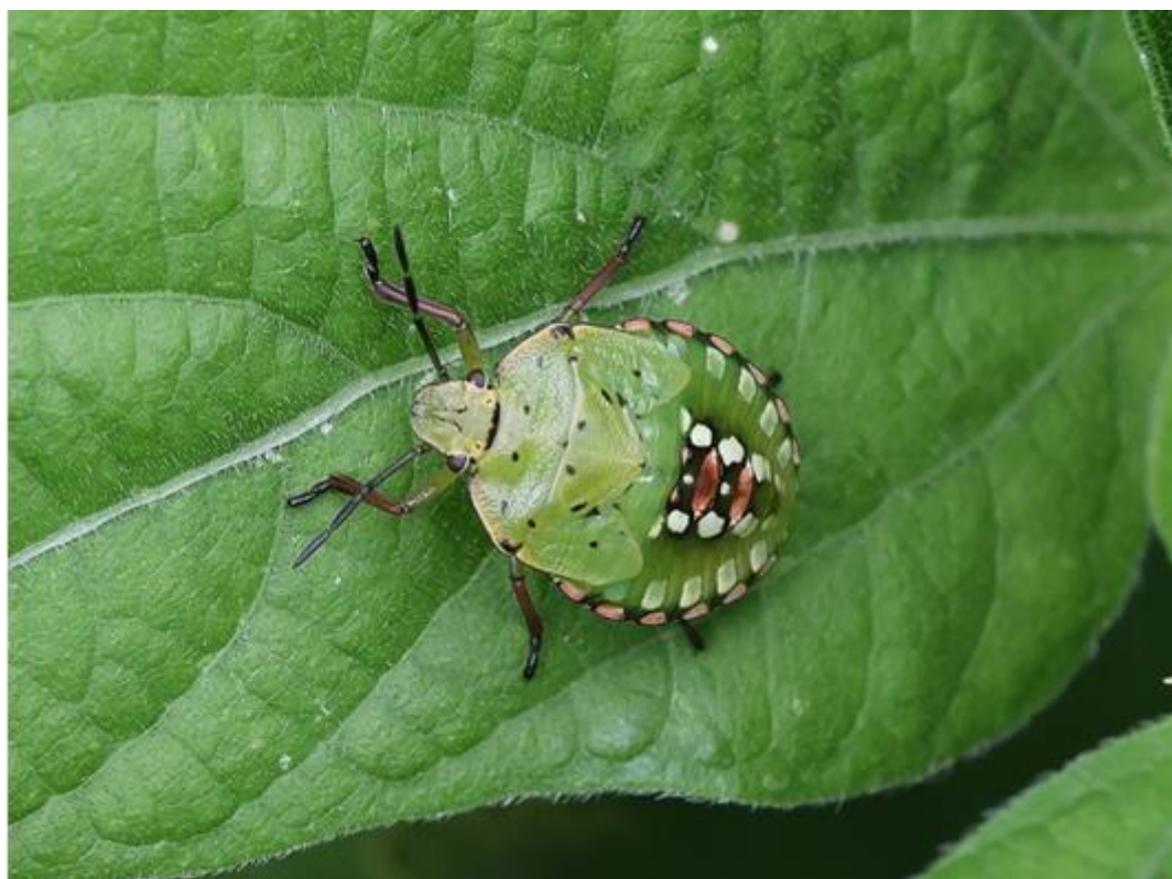
Jeune punaise verte essayant de passer incognito