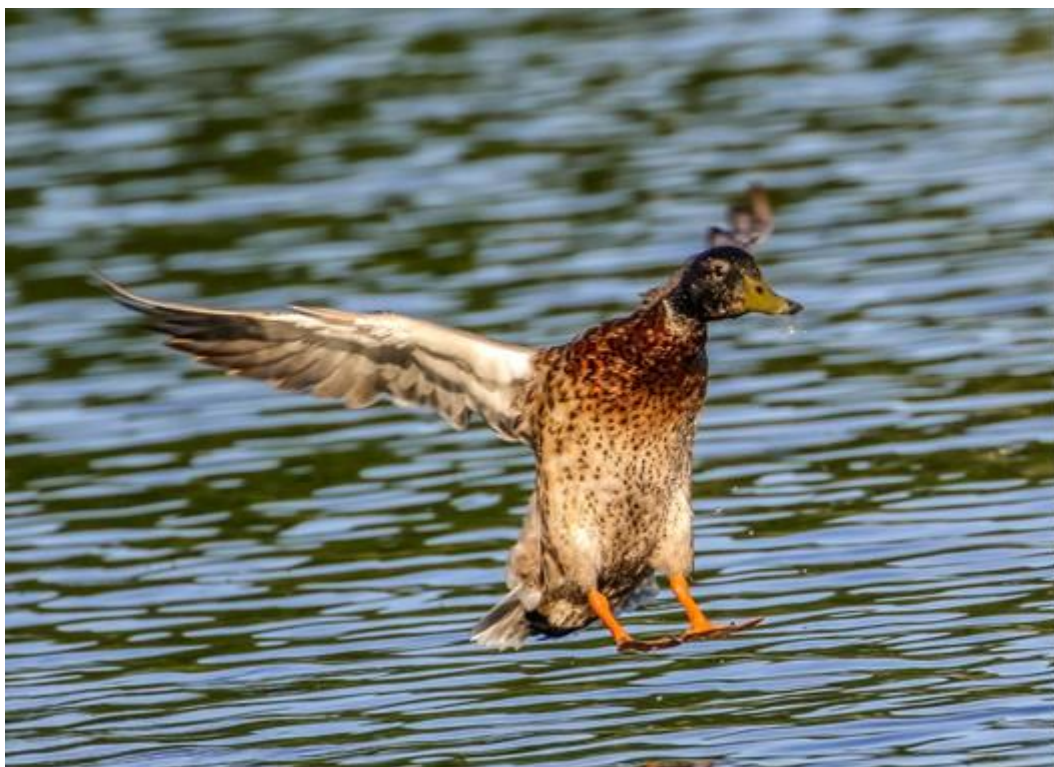
Canard Colvert en plein atterrissage contrôlé