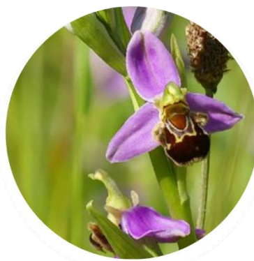
OPHRYS ABEILLE (OPHRYS APIFERA)

Les Ophrys sont souvent polymorphes (=plusieurs formes possibles) ce qui rend parfois leur identification délicate.