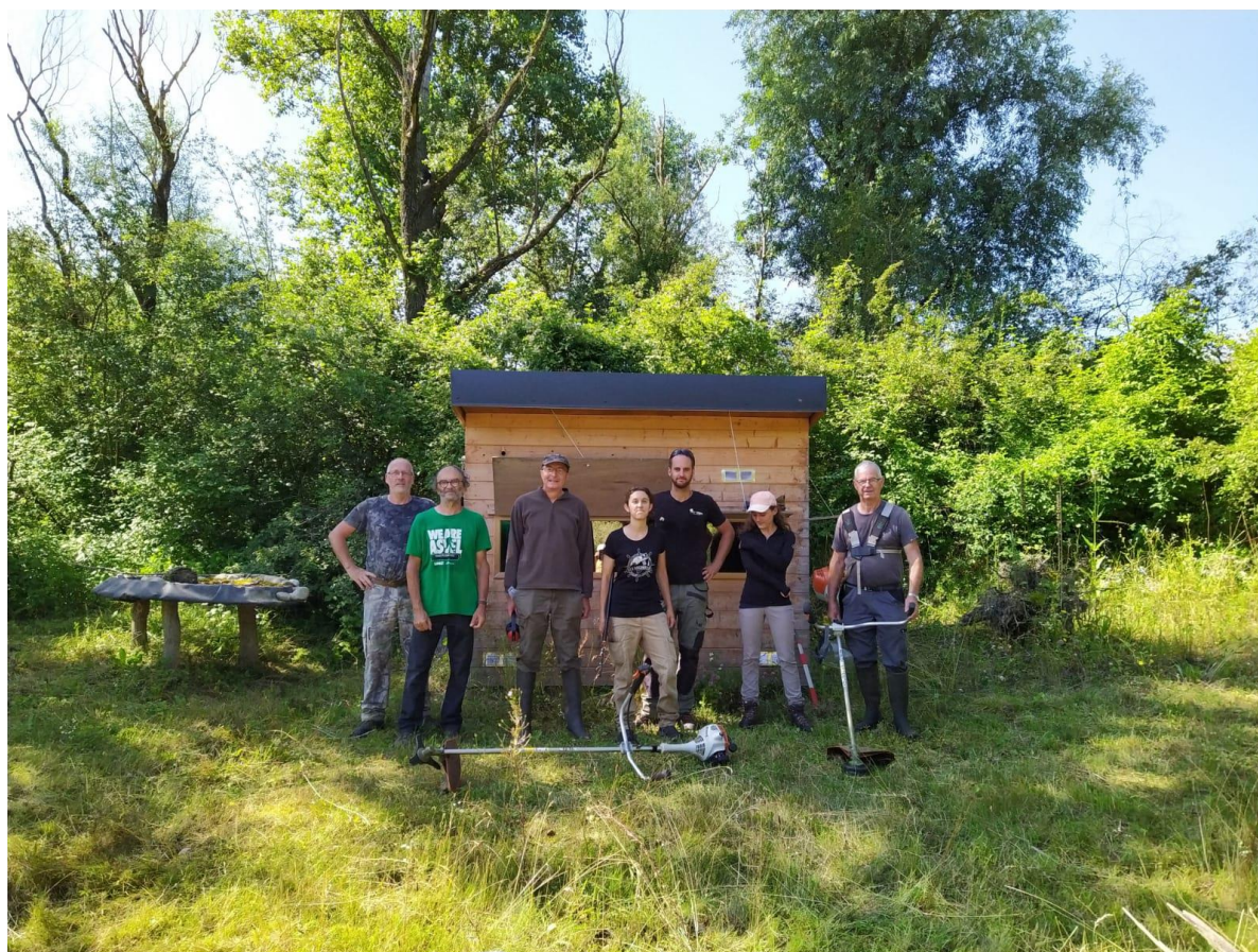
Collaboration entre APIE et ACCA pour favoriser l'accueil de la biodiversité à La Verne

L'APIE a organisé un chantier comme l'an passé afin de rouvrir ces secteurs. Cette année, elle a travaillé en collaboration avec l'ACCA de Vaulx-Milieu, que nous remercions pour sa participation. Ce jour-là, l'objectif était d'entretenir les milieux aux abords du sentier principal et des mares créées dans le cadre de la gestion du site. Ce chantier devrait être reconduit de façon annuelle.