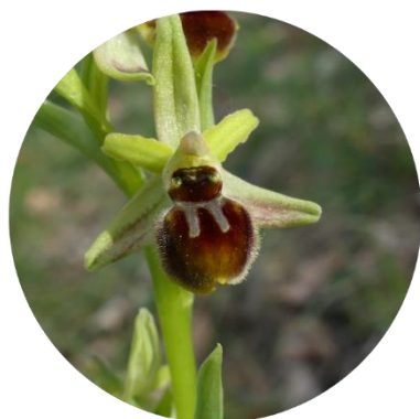
OPHRYS ARAIGNÉE (OPHRYS ARANIFERA)