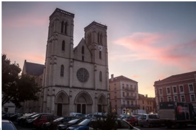
Centre ville de Bourgoin Jallieu encombré