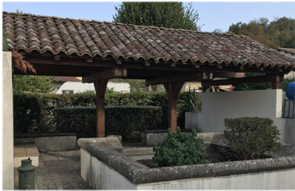
Lavoir de Vaulx Millieu