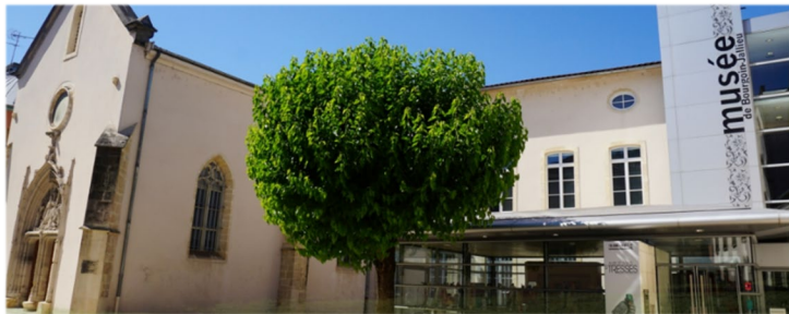
Musée textile de Bourgoin Jallieu