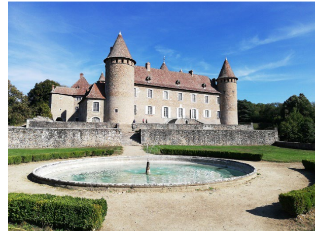
Château de Virieu