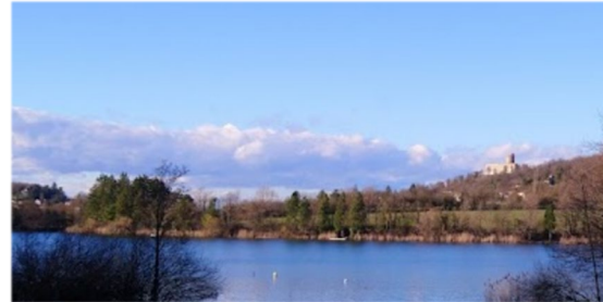
Parc de St Quentin Fallavier