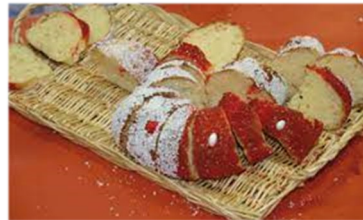
Les brioches de St Genix et de Bourgoin Jallieu