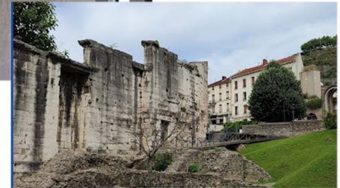
Jardin archéologique de Cybèle - Vienne