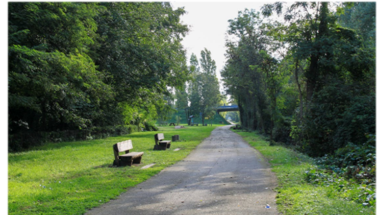
Voie verte de la Bourbre - Source : Mairie de l'Isle d'Abeau