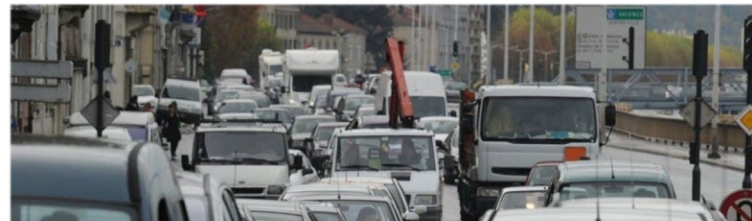
Traffic à l'entrée de Vienne