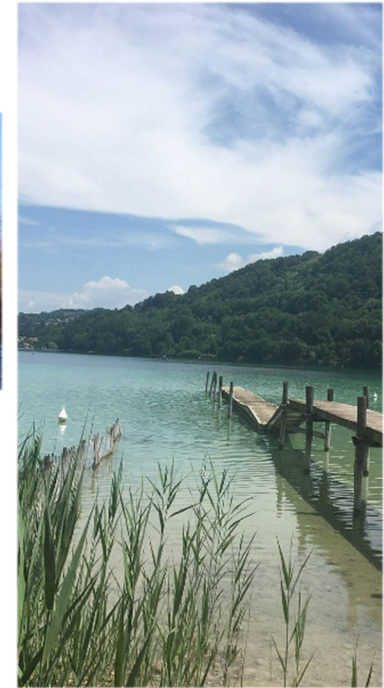
Lac du Paladru