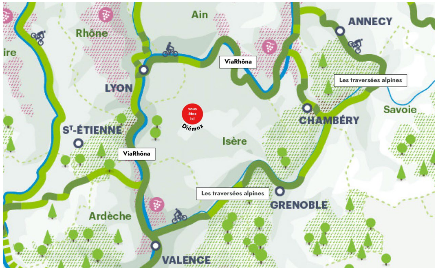
Schéma régional des véloroutes de la Région Auvergne-Rhône-Alpes https://www.auvergnerrhonealpes.fr/aides/amenager-une-veloroute