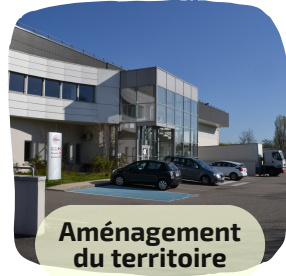
Aménagement du territoire