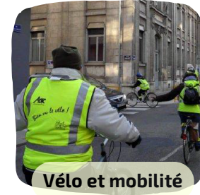
Vélo et mobilité